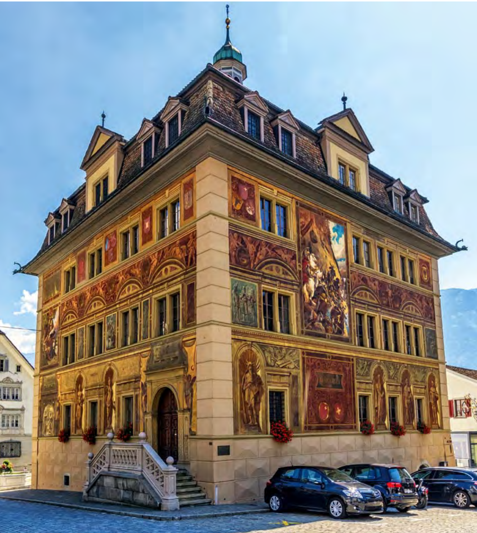
Das Schwyzer Rathaus ist eine der eindrucklichsten und bedeutendsten Profanbauten des Kantons