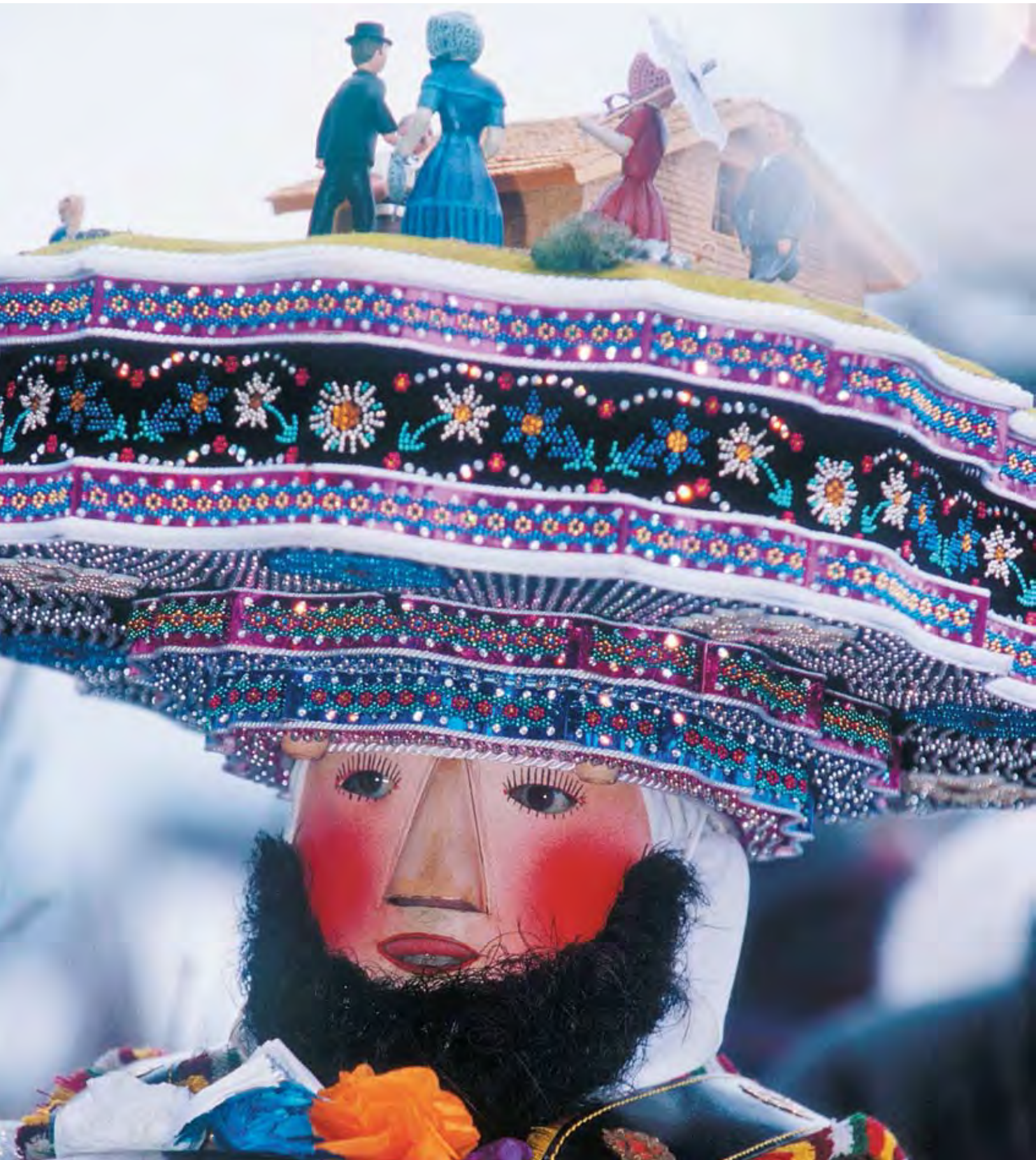
Silvesterchlausen in Urnäsch, Appenzell Ausserrhoden