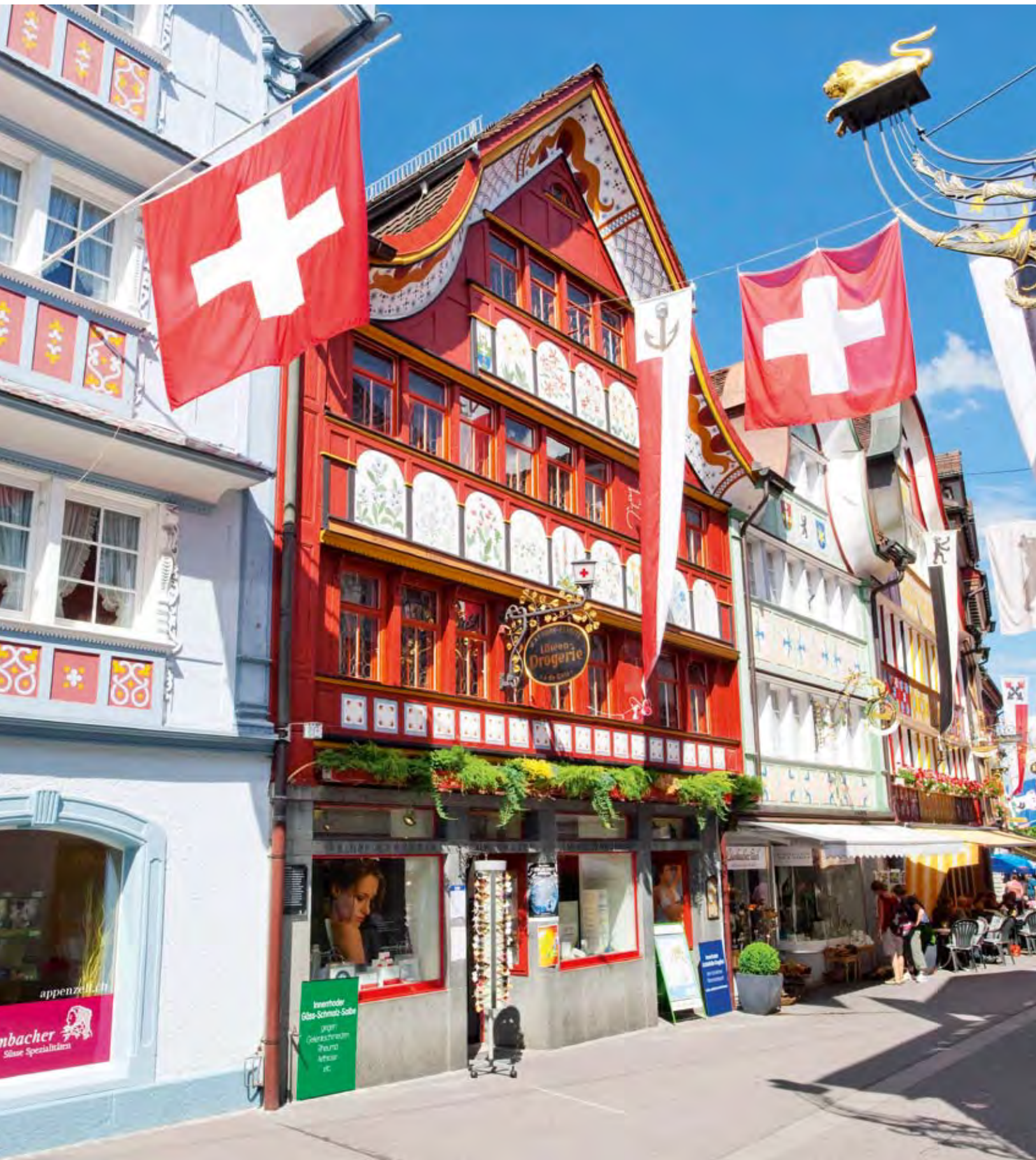
Die Hauptgasse im Hauptort des Kantons Appenzell Aargovien