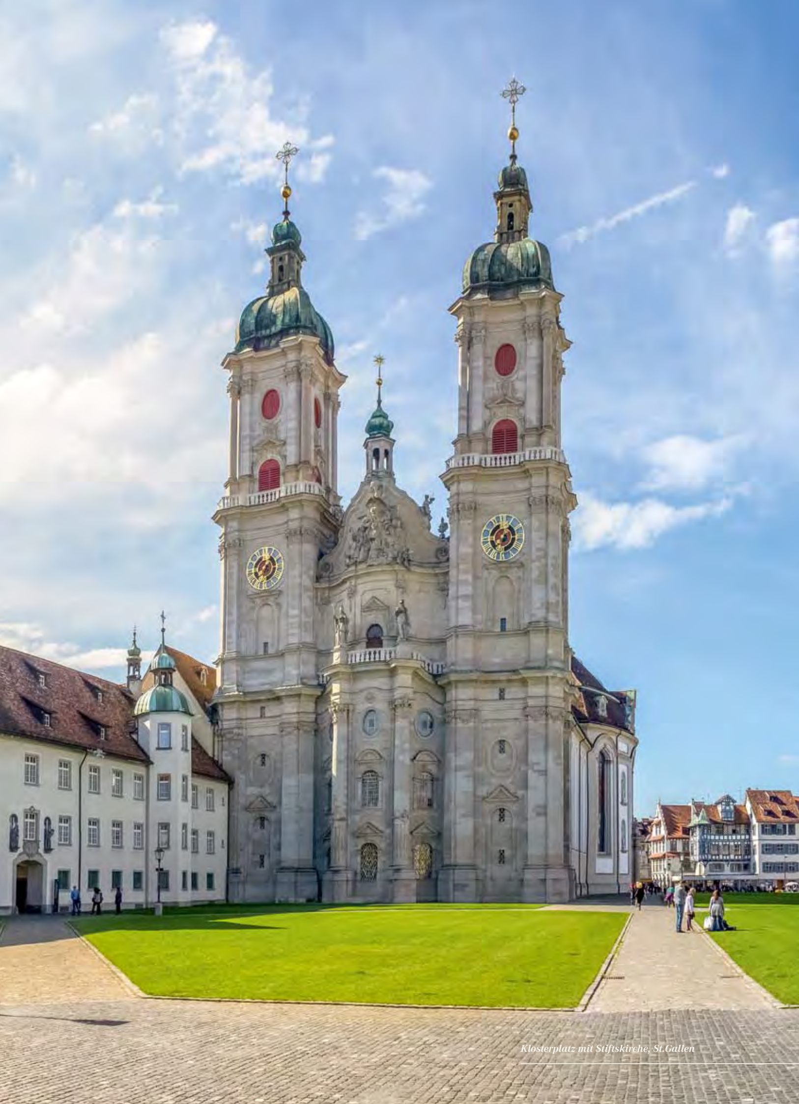
Klosterplatz mit Stiftskirche, St.Gallen