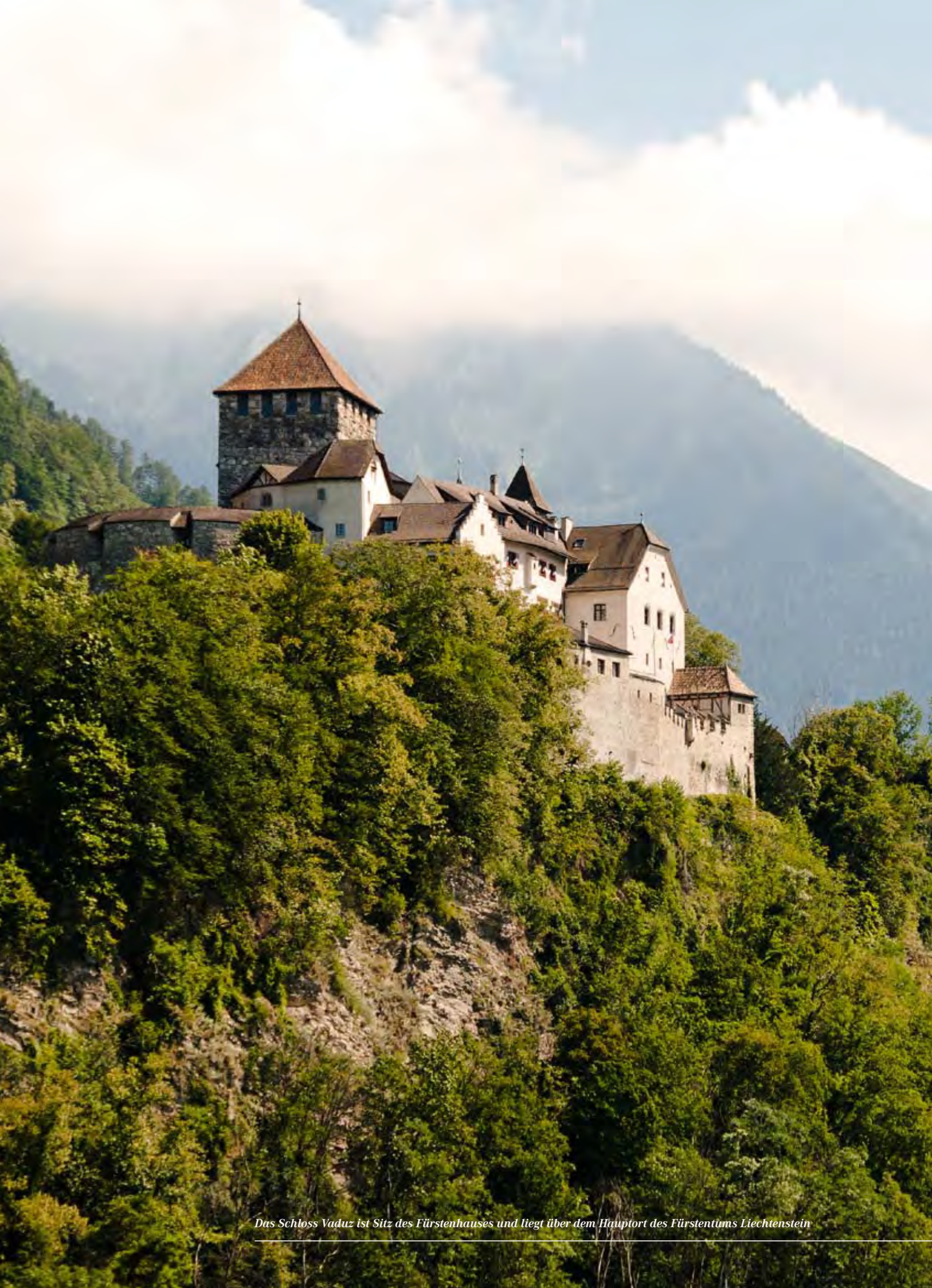
Das Schloss Vaduz ist Sitz des Fürstenhauses und liegt über dem Hauptort des Fürstentums Liechtenstein