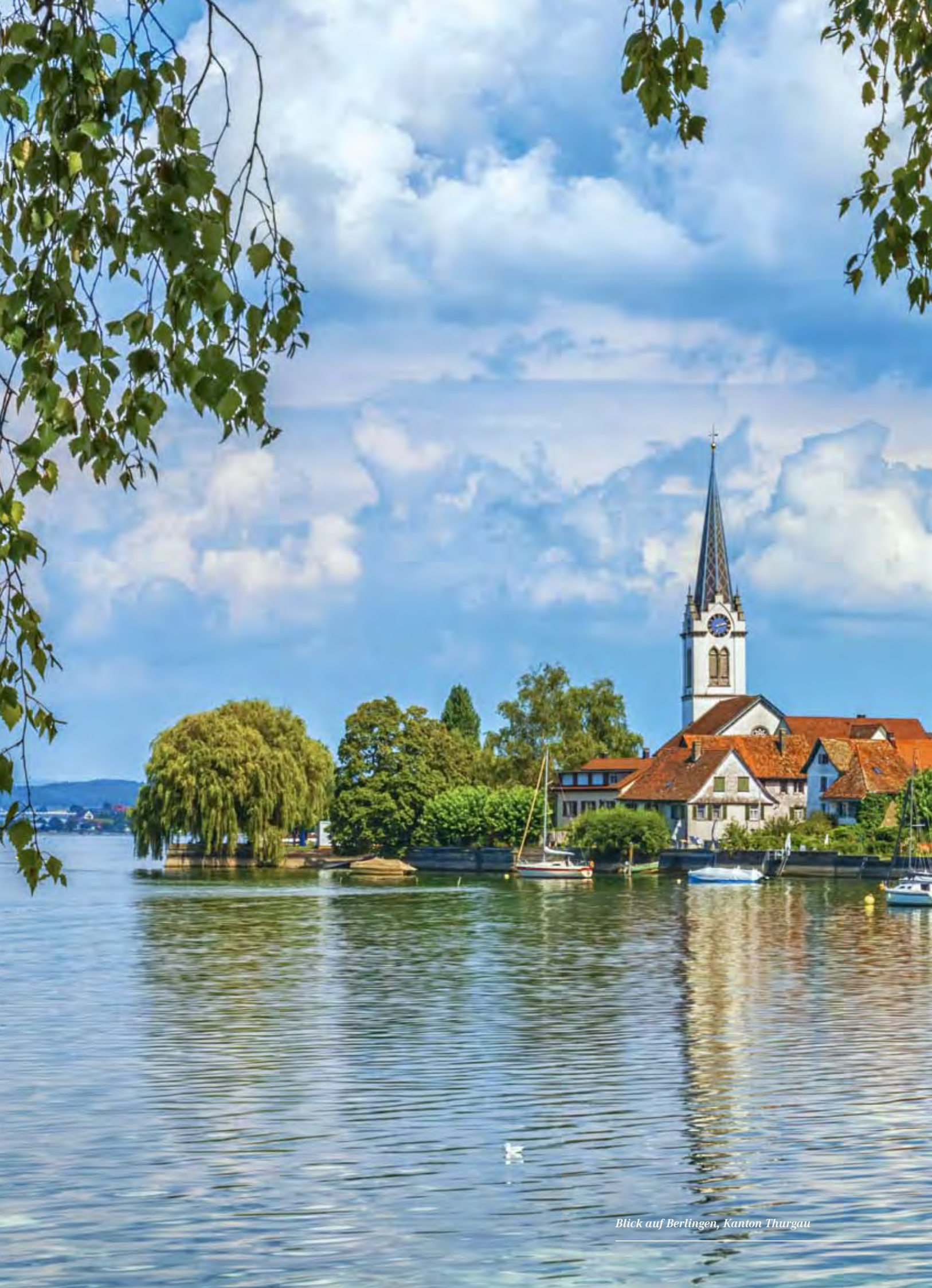
Blick auf Berlingen, Kanton Thurgau