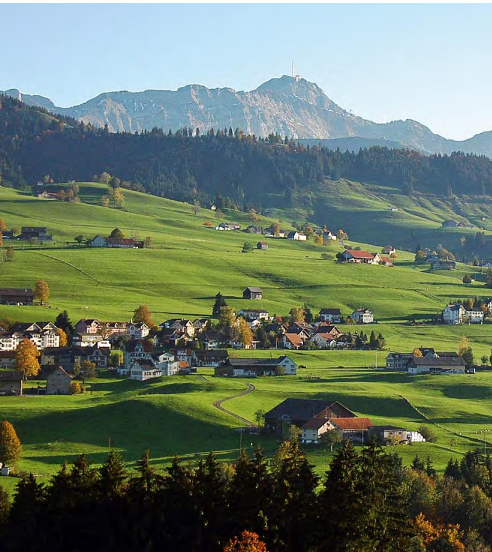
Hundwil im Kanton Appenzell Ausserrhoden mit Säntis