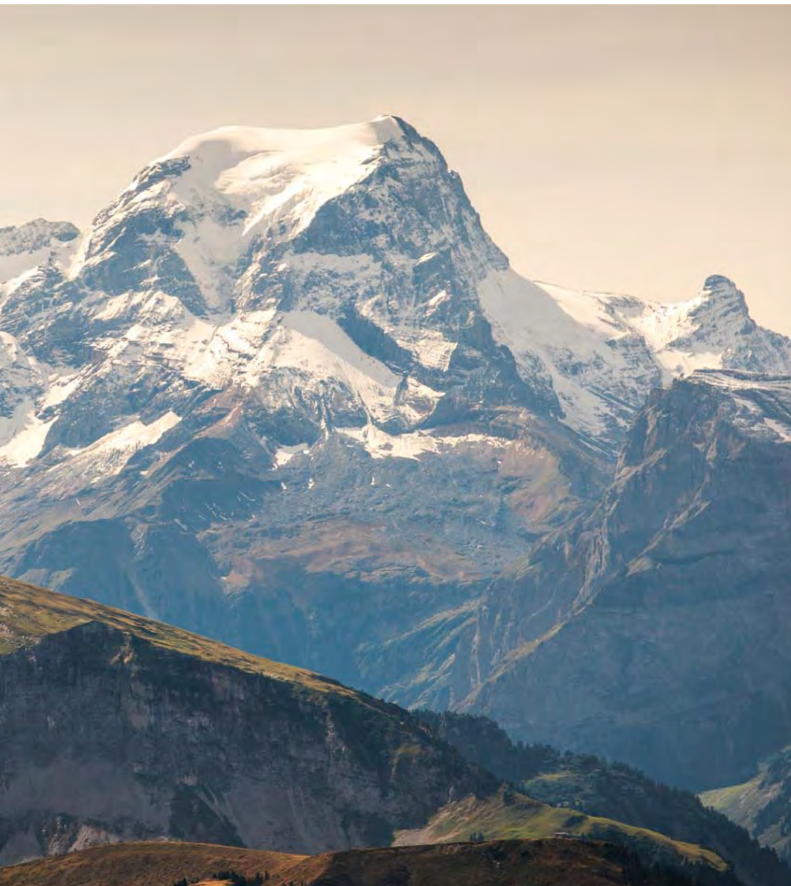
Aussicht auf den Tödi von Aeugsten her, Kanton Glarus