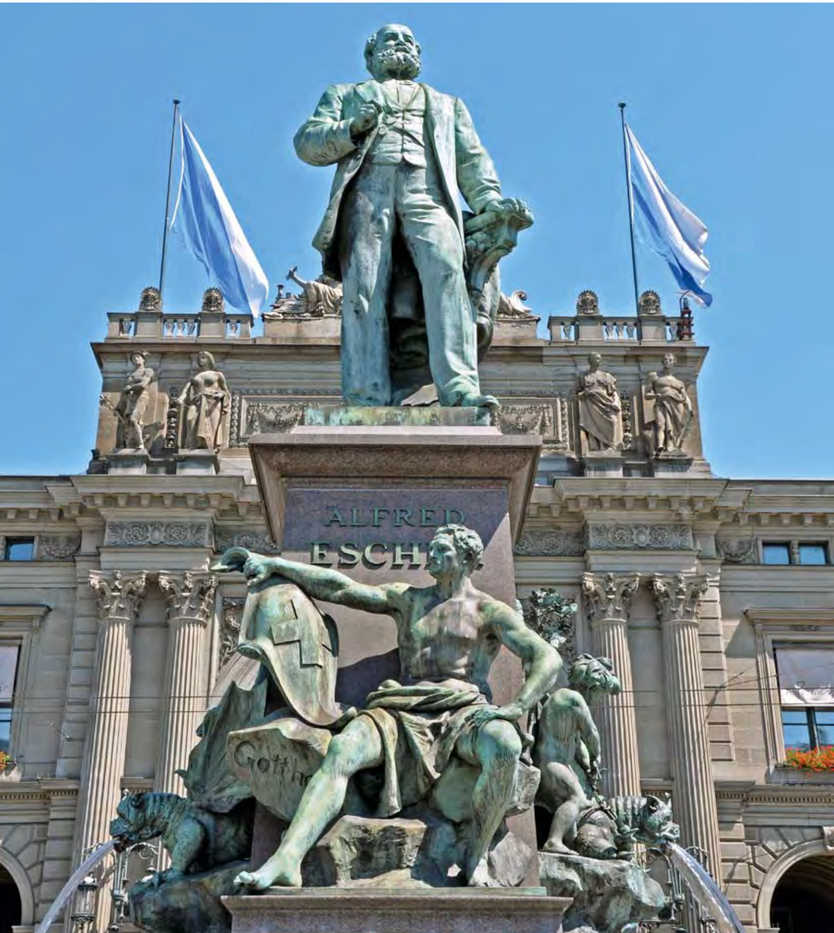
Alfred Escher-Denkmal am Hauptbahnhof Zürich