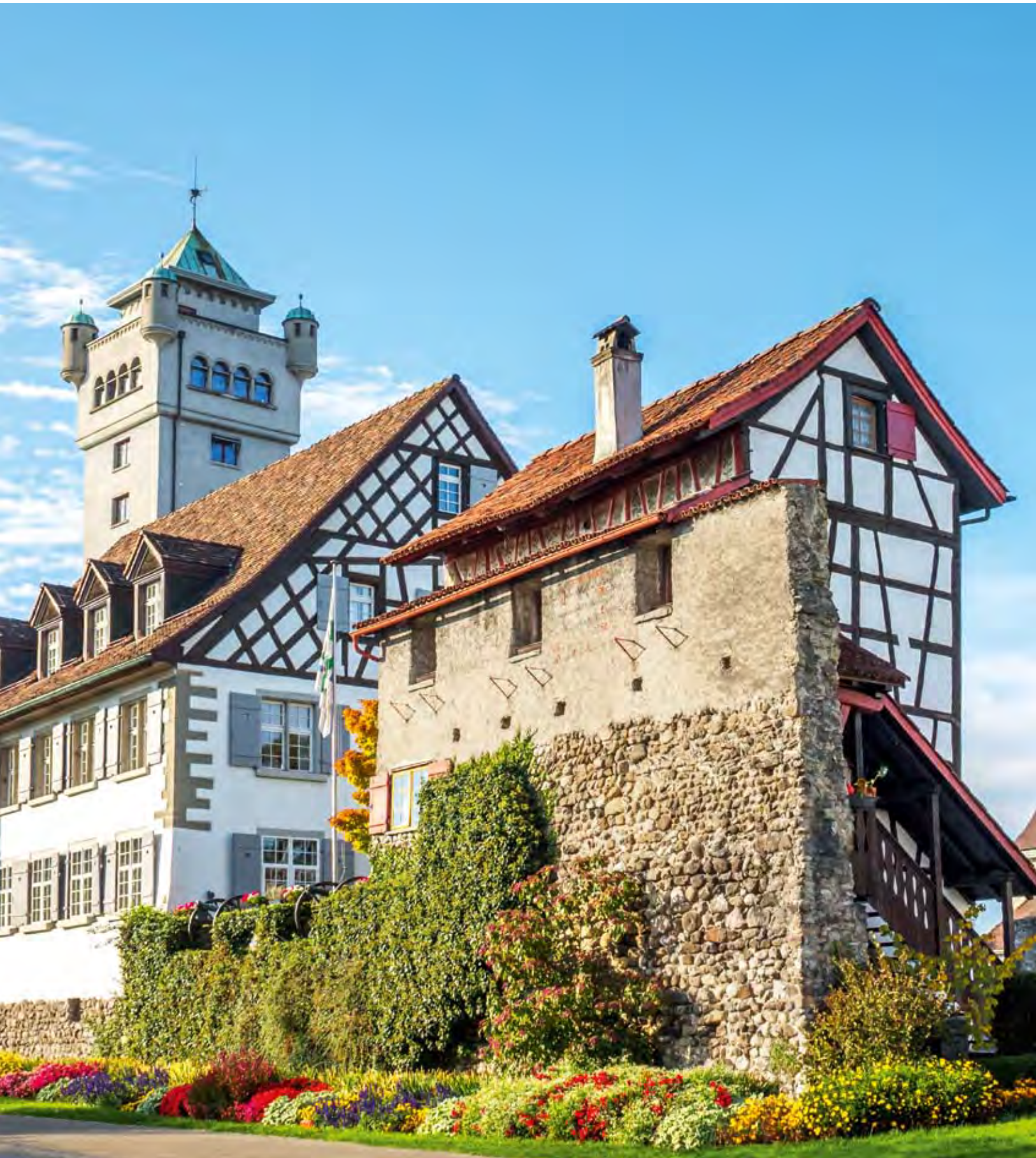
Der Römerhof in Arbon, Thurgau