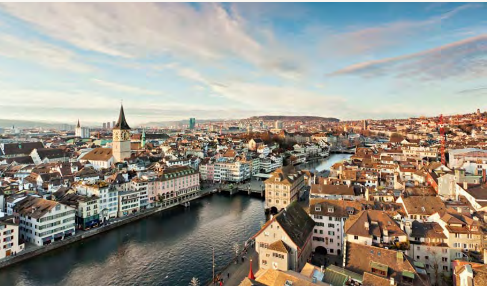
Blick vom Grossmünster auf Zürich

Die EDK-Ost lässt sich über die auf 1996 geplante Eröffnung der Sportmittelschule Davos orientieren.