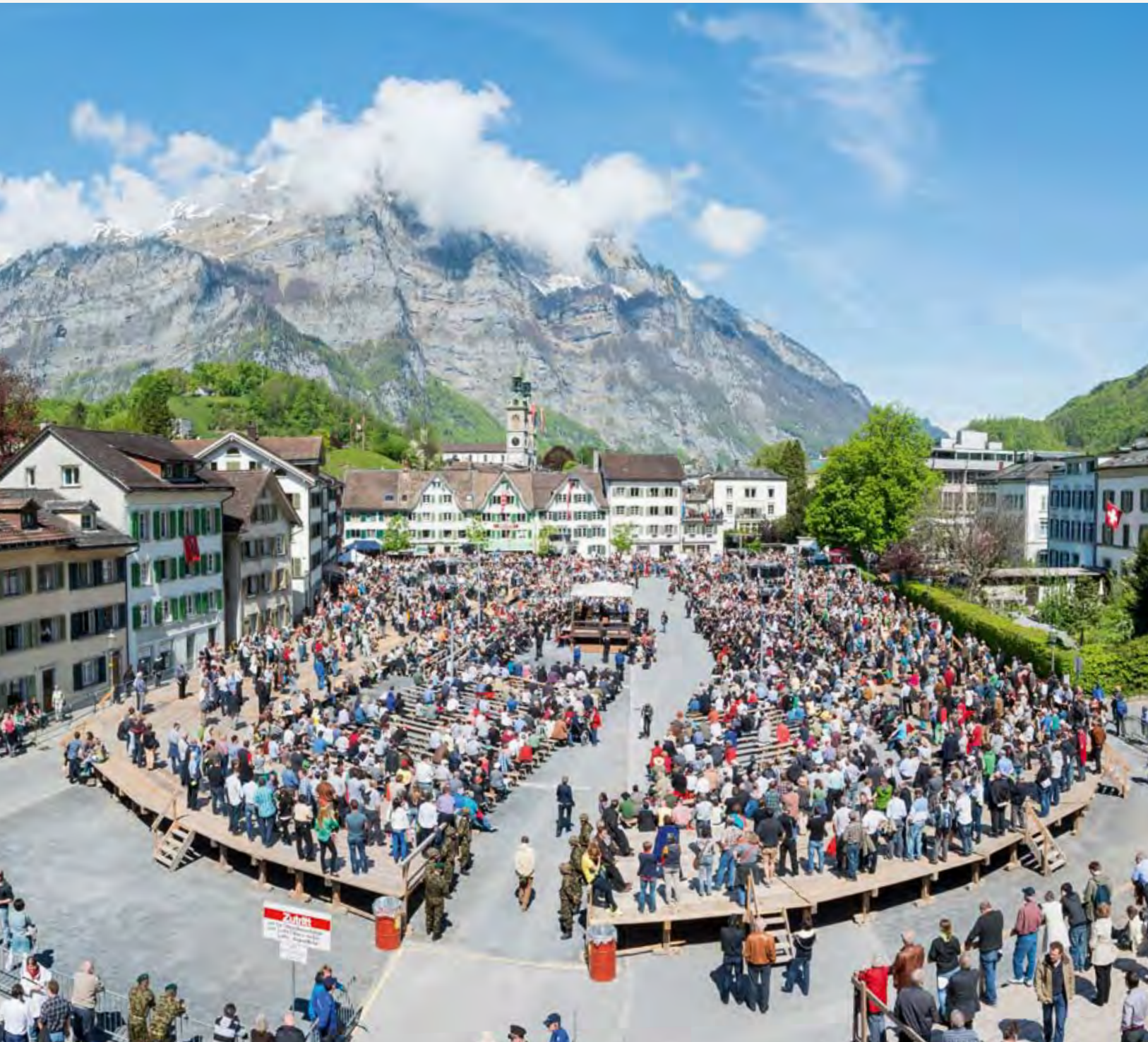
Landsgemeinde auf dem Zaunplatz in Glarus

leitung wird beauftragt, im Rahmen der Projektarbeiten Finanzierungsmodelle für eine mögliche Einführung der Grund-/Basisstufe weiterzuentwickeln und die Ergebnisse der EDK-Ost vorzulegen.