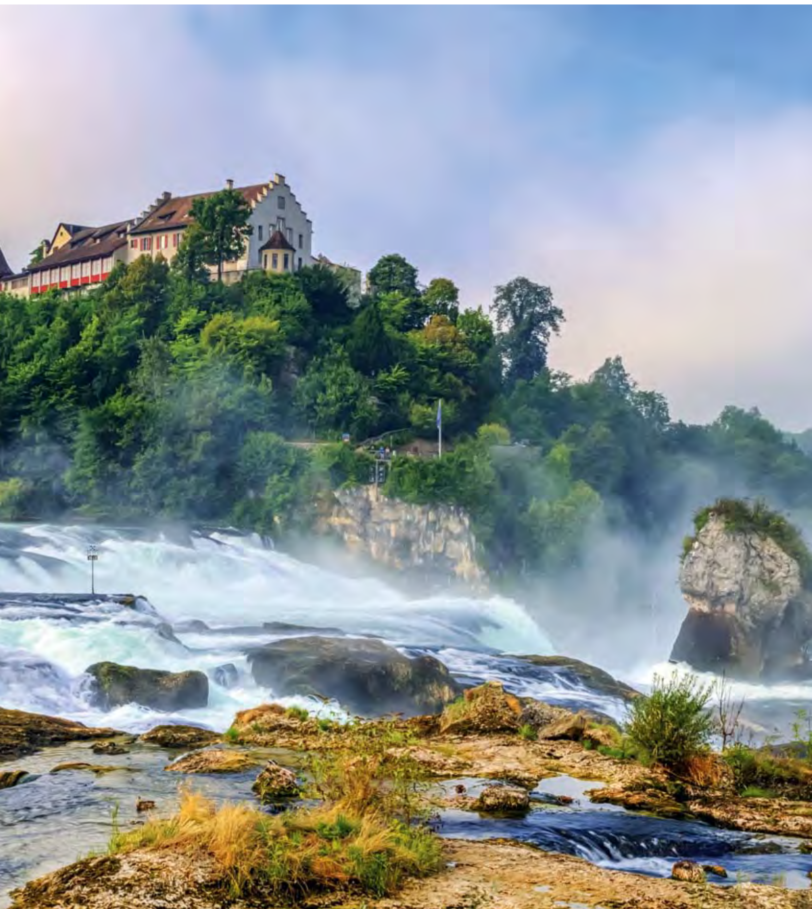
Blick von Neuhausen im Kanton Schaffhausen auf den Rheinfall mit Schloss Laufen