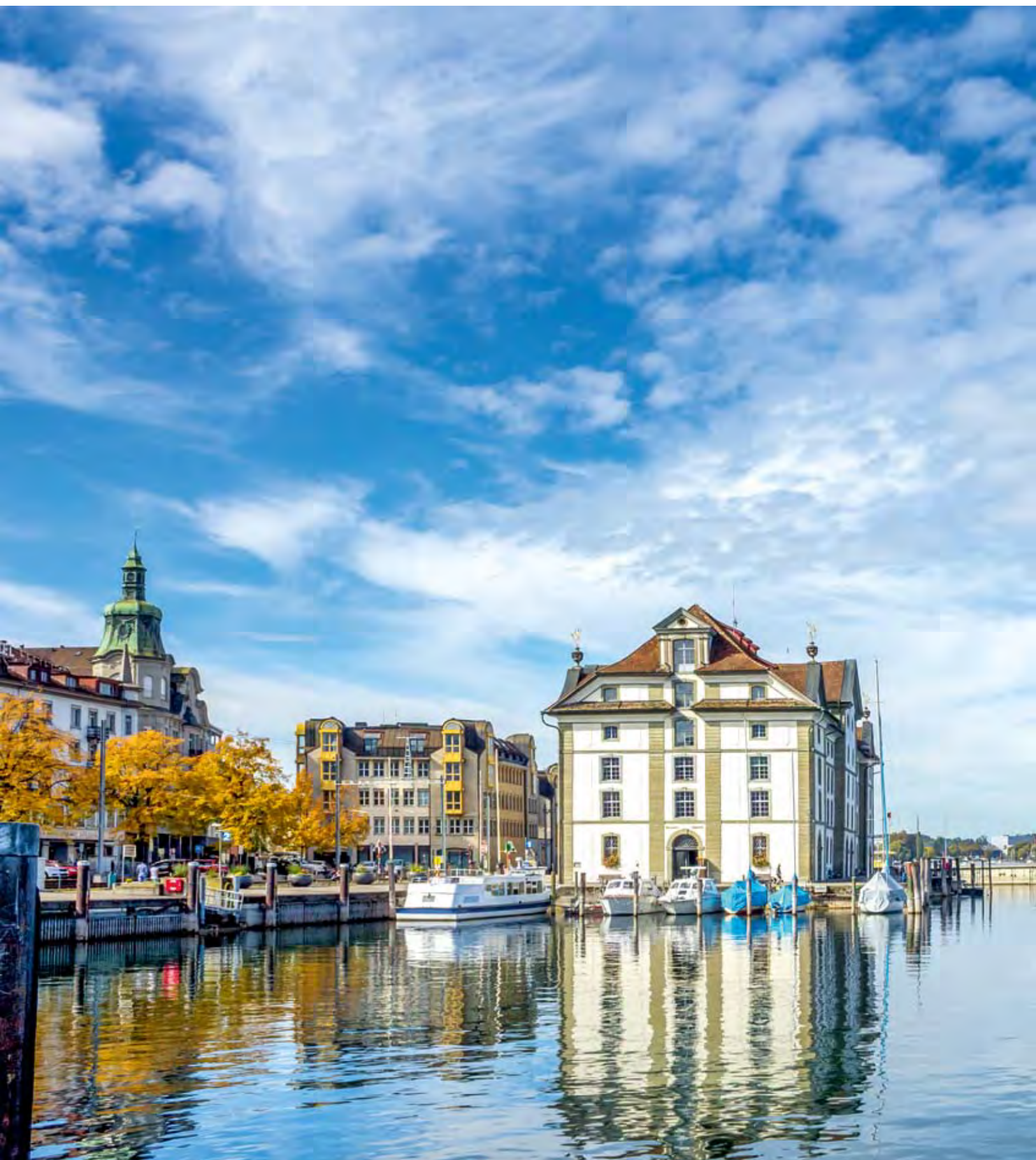
Kornhaus und Hafen in Rorschach, St.Gallen