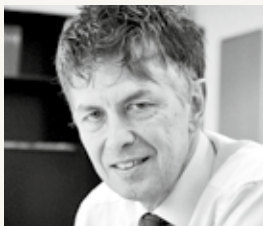
Regionalsekretär Jürg Raschle Generalsekretär des Bildungsdepartements des Kantons St.Gallen