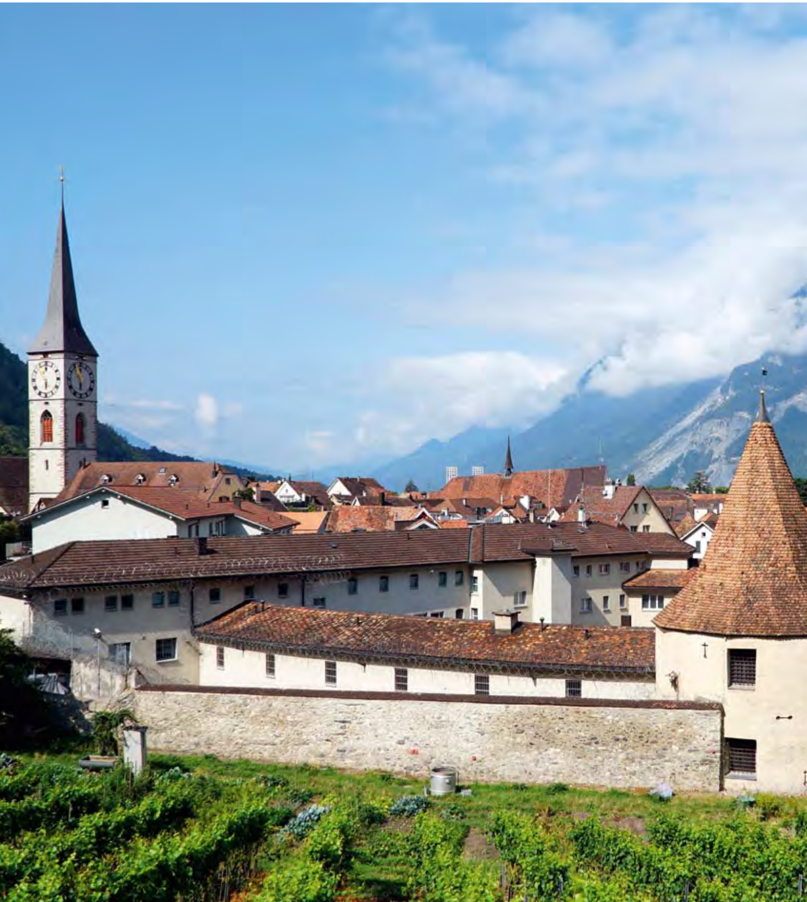
Blick über die Dächer der Altstadt von Chur