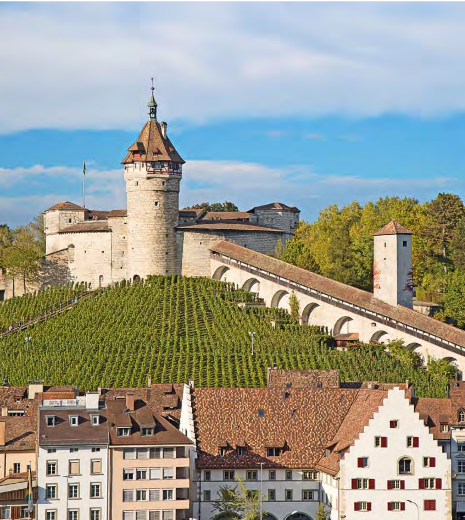
Der Munot mit Rebberg im Zentrum von Schaffhausen