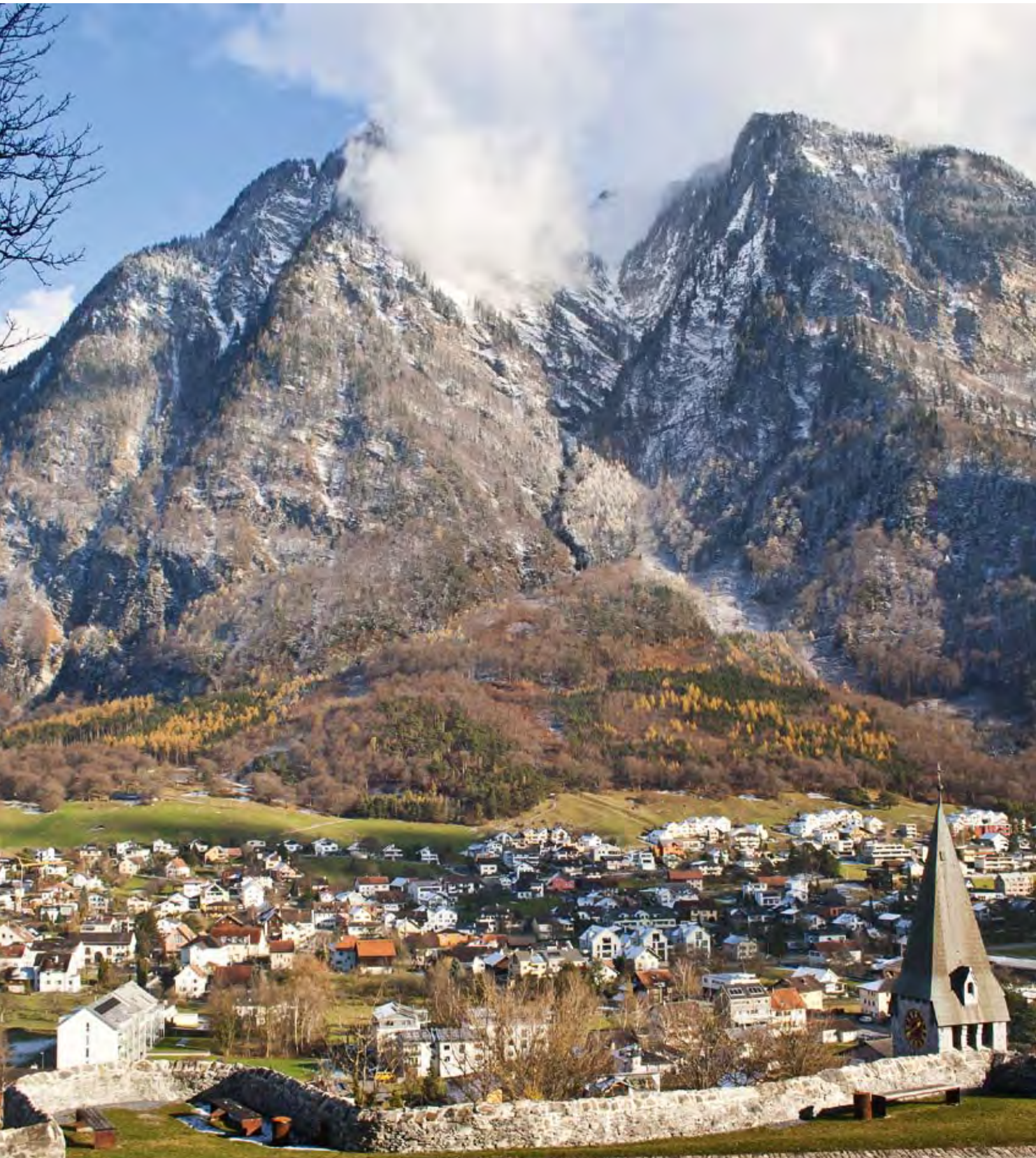
Blick von der Burg Gutenberg auf Balzers, Fürstentum Liechtenstein