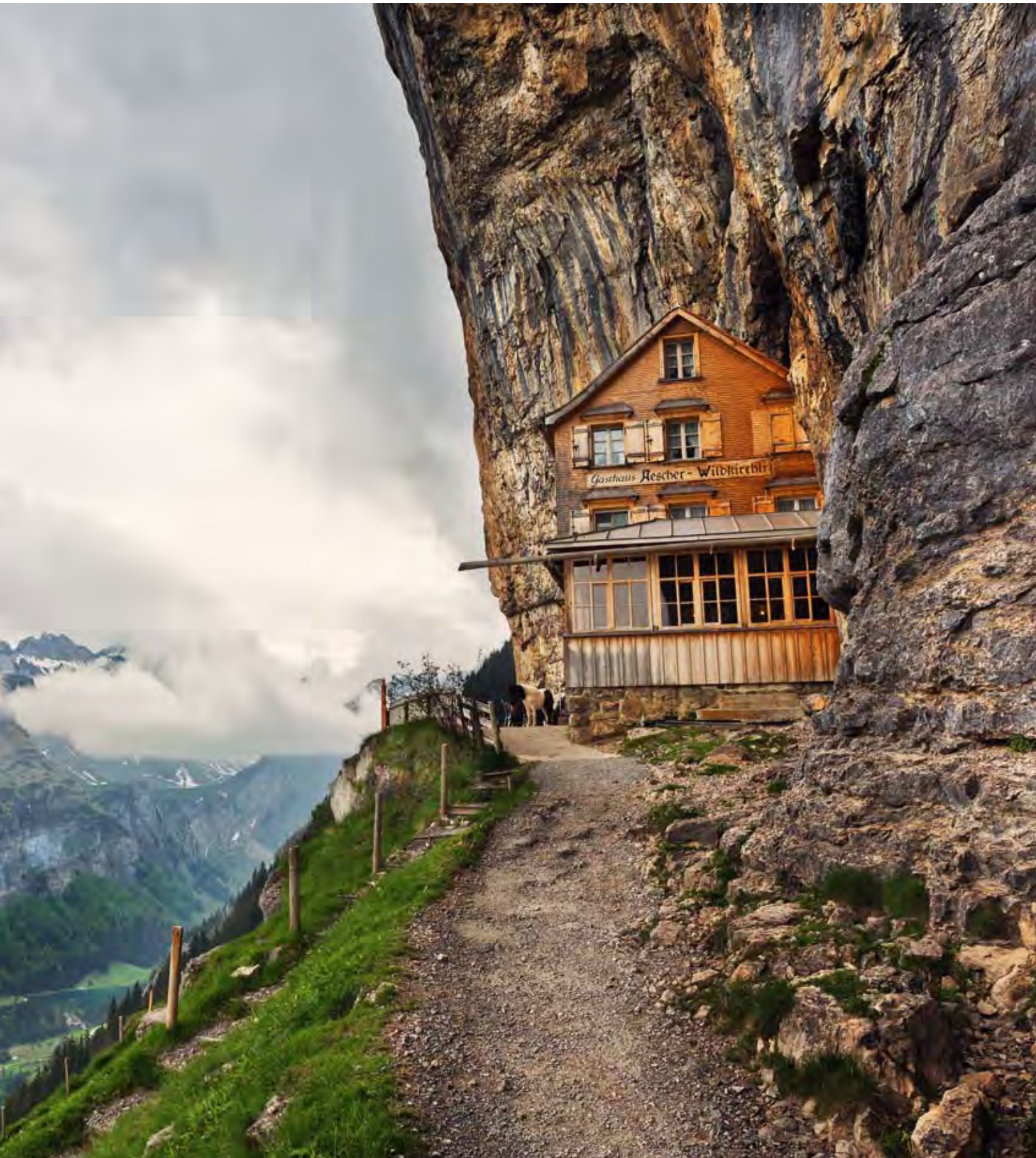
Berggasthaus Aescher-Wildkirchli, Appenzell Innerrhoden