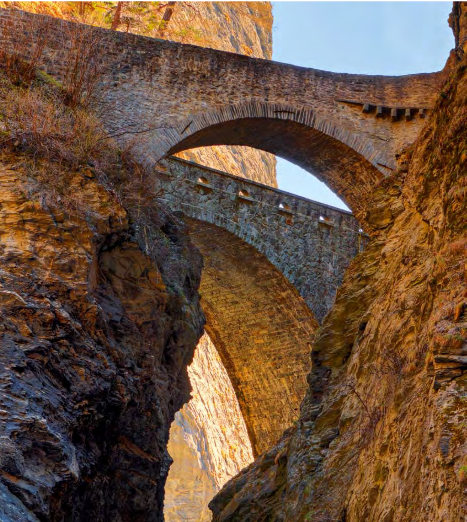
Brücke über die Viamala-Schlucht bei Thusis, Kanton Graubünden